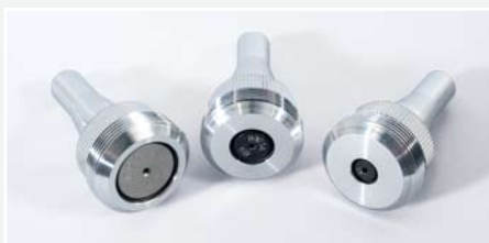
Különböző jelölő fejek és tűk

A tűs jelölő fej egy masszív gép állványra van felerősítve, amely tartalmazza az orsós magasság állítást is. A beállított magasság egy számlálón jelenik meg. A tekerő kerék egyszerűsíti a megfelelő tű pozíció beállítását.