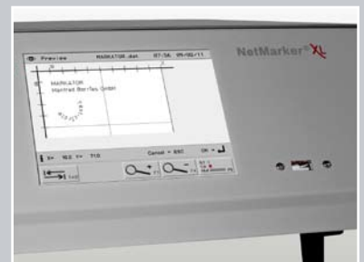
Színes LCD kijelző és USB csatlakozó a vezérlő előlapján