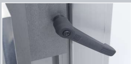
Tilspændingsmulighed over klemmehåndtag