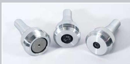
Markeringsværktøj af høj kvalitet

Nålemarkeringshovedet er monteret på et stabilt maskinbord med højdeindstillelig søjle. Højden, der indstilles over et håndhjul, vises digitalt. Dette gør indstillingen af den rette position nemmere. Yderligere er der integreret en tilspændingsmulighed med 2 klemmehåndtag, der fastholder markeringshovedet i den indstillede position. En fejlagtig indstilling af nåleafstanden er dermed udelukket og et konstant godt markeringsbillede garanteret. Ved hjælp af et lille vindue, er en præcis positionering af markeringsnålen i x/y-position over materialet mulig.